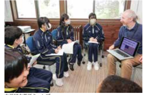
中学国内英語キャンプ