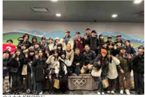
中3 カナダ修学旅行