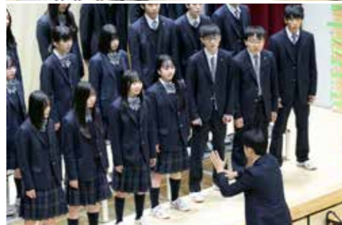
中学高校合唱コンクール