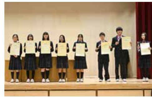
中学スピーチコンテスト