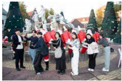
高校修学旅行(長崎・福岡)