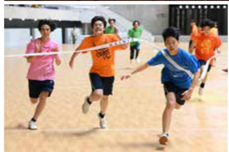
中学校体育祭(代々木第一体育館)