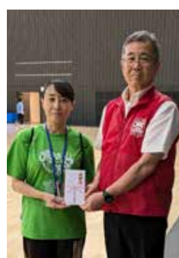
校友会からダンス部世界大会出場のお祝いをお渡しました。

2025年8月20日の水曜日。2025年8月22日(金)～24日(日)の期間で行われる「Aussie Gold Cheer & Dance」主催の「2025 Aussie Gold Pan Pacific Cup International Championships」に出場するために、「Miss Dance Drill Team Japan」として成田空港に集まったダンス部員の21名。空港には多くの保護者の方々と卒業生が見送りに来てくれていました。そこで披露された、大きな日本の国旗の寄せ書き。それを見た瞬間、それまでの緊張の糸がほどけてしまい、早くも感動の涙を流す生徒や歓喜の声をあげる生徒がいました。たくさんの先生方や先輩達、学校施設の方々と練習で使用させていただいた外部施設の方々からの、たくさんの応援メッセージ。応援してくれる人達がいる。そのことに、様々な思いを抱えていた気持ちがあふれ出し、どれだけ勇気づけられたか分かりません。「応援してくれる人々のために、感謝の気持ちを込めて最高の笑顔で！最高の演技を！」。その思いを胸に臨んだ23日(土)大会当日、「Gold Coast Sports & Leisure Centre」会場で、晴れやかな演技を披露し、HIP-HOP部門 第4位という素晴らしい結果を得ることができました。貴重な経験と、素晴らしい体験をして帰国したダンス部員たち。支えて下さった保護者の皆様方、応援して下さいました皆様方、本当にありがとうございました。これからも、頑張ります！