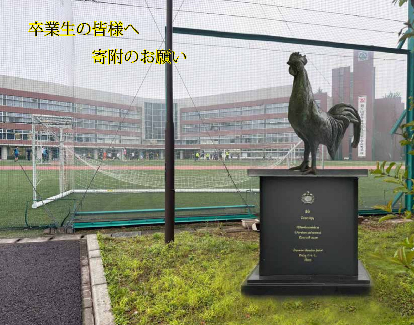
▲設置イメージ(合成)