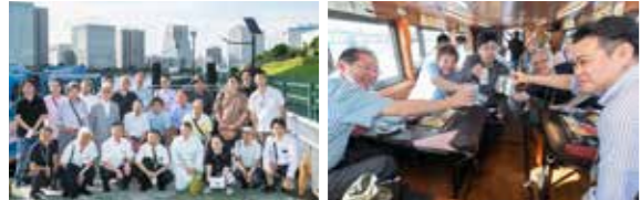
屋形船にて懇親を深める